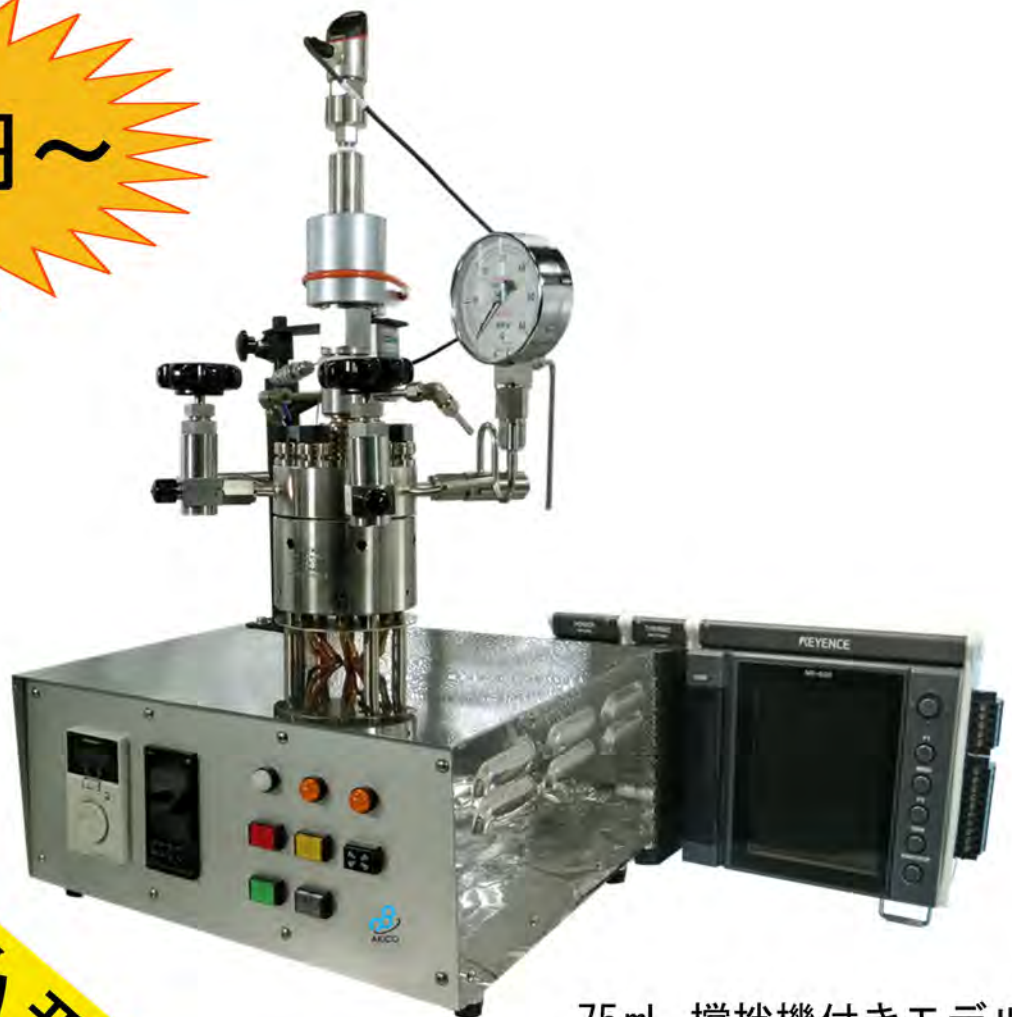
75 mL 攪拌機付きモデル